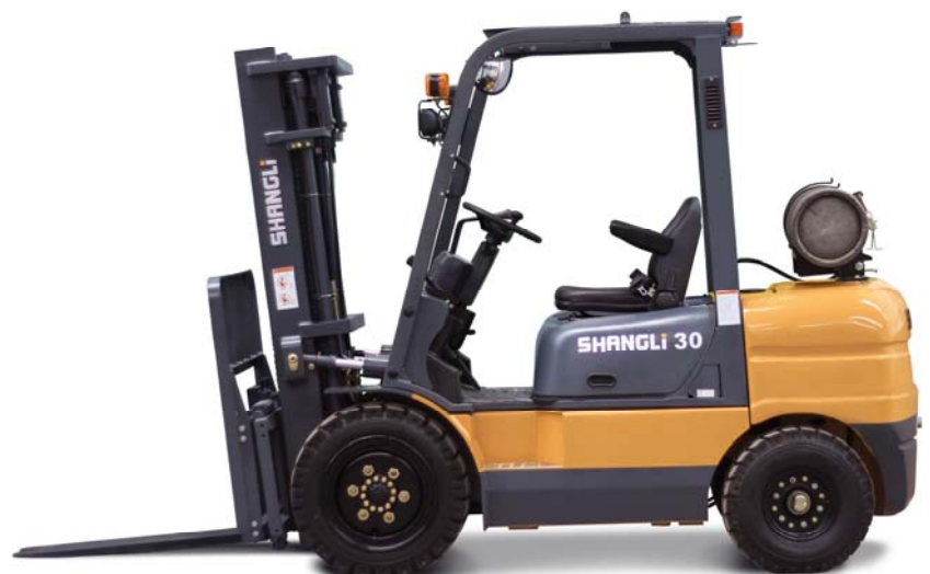
CPQYD30/3 GLP 3.000KG RODADO SIMPLES